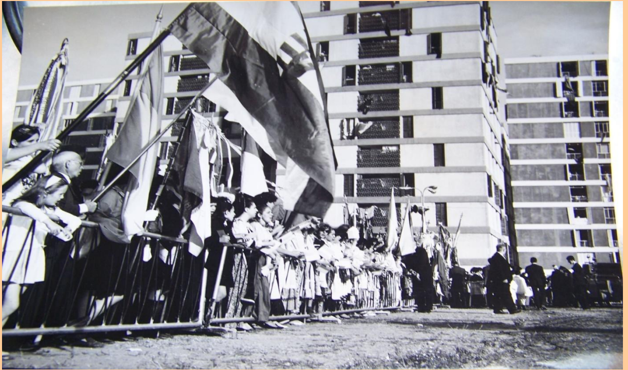
Vista parcial del público en general