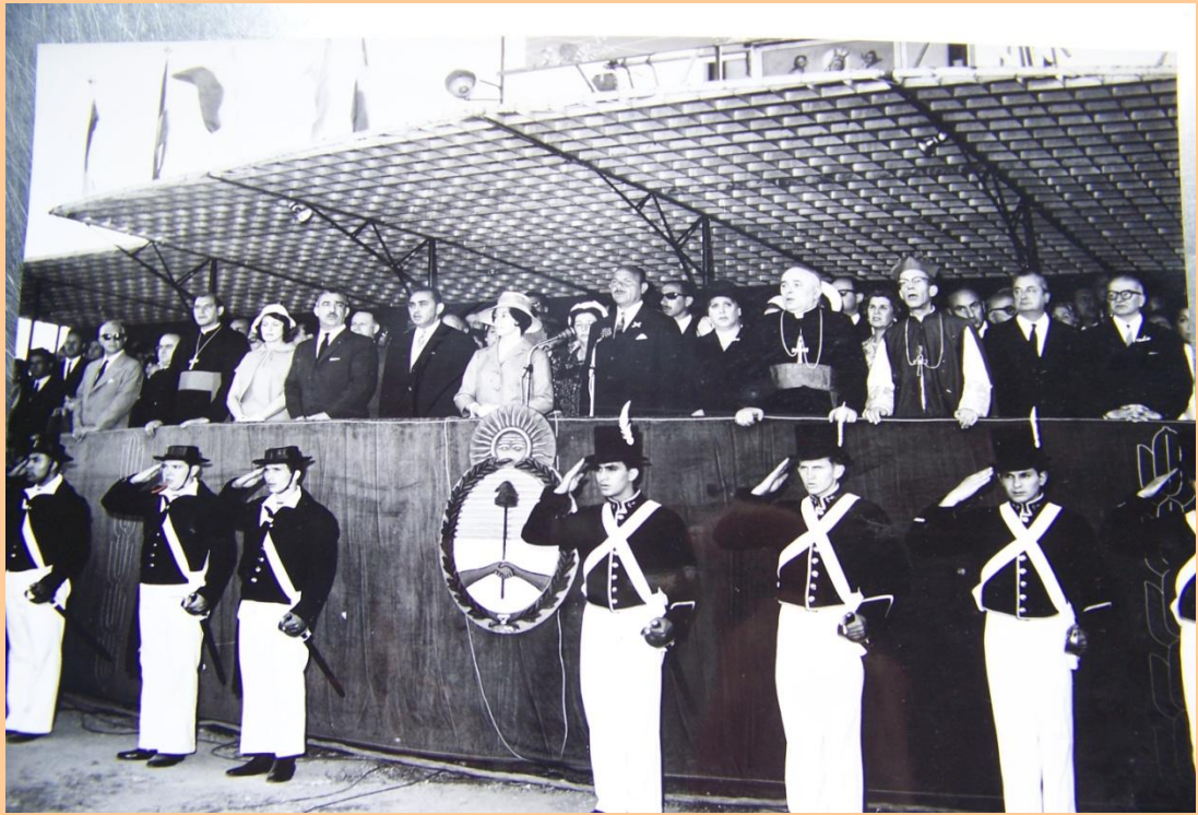
La banda de música de la Aeronáutica acompañó el canto de Himno Nacional y todo el resto del Acto.